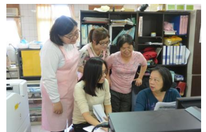
104. 12. 23 護理外督