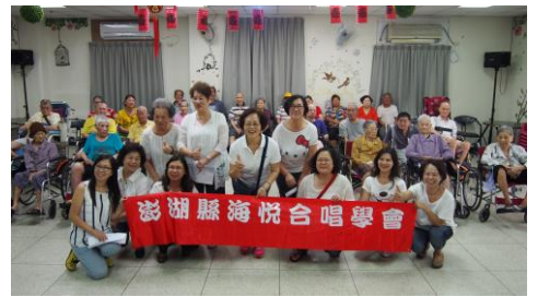
104. 09. 19 海悅合唱團