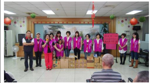
104. 12. 13 婦女協會慰訪