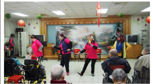
104. 12. 13 中國國民黨部、婦女展望會、俏女狼慰訪