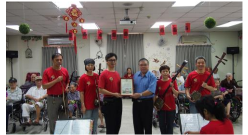
104. 11. 19 肢體殘障協會管絃樂團慰訪