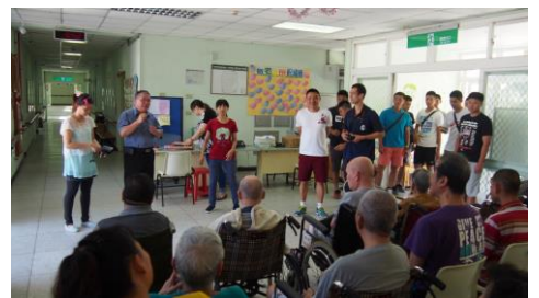
104. 09. 19 憲兵指揮部