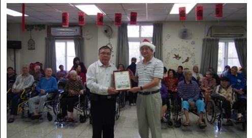
104. 12. 23 耕讀幼稚園慰訪