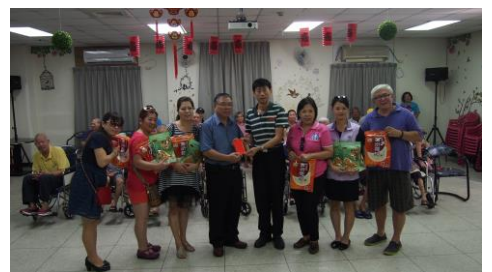
104. 09. 25 馬公扶輪社