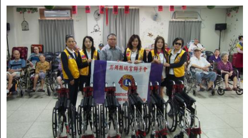
104. 09. 17 馬公獅子會蒞臨捐贈輪椅