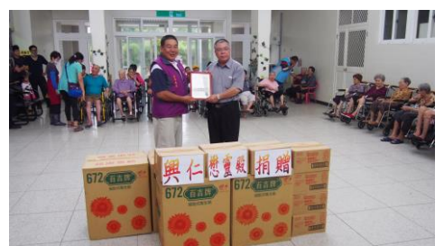
104. 09. 28 興仁懋靈殿