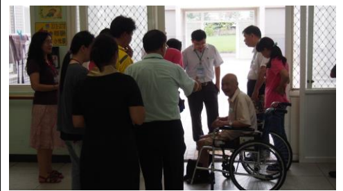
104. 09. 07 高齡友善機構認證實地查核