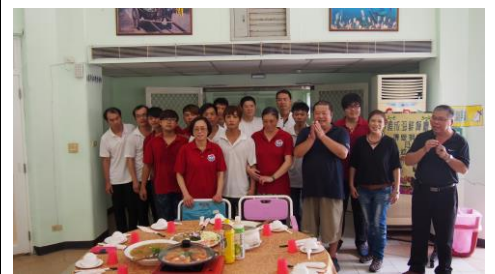
104. 09. 15 順成餐廳辦桌